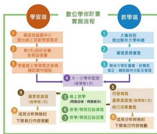
【圖 3 數位學伴計畫實施流程】