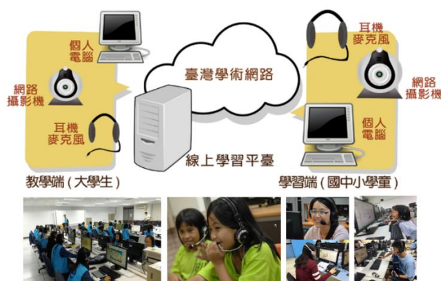
【圖 1 數位學伴計畫線上環境與設備架構】

以大學學伴制為概念，招募、培植大學生擔任偏遠地區國民中小學學童之學伴，藉由視訊設備與線上學習平臺，讓教學端(大學生)與學習端(國民中小學學童)以定時、定點、集體(集中於學校電腦教室)方式，每週 2 次(每次 2 堂課，每堂課 45 分鐘)，進行一對一線上即時陪伴與學習，提供資訊應用及學習諮詢。